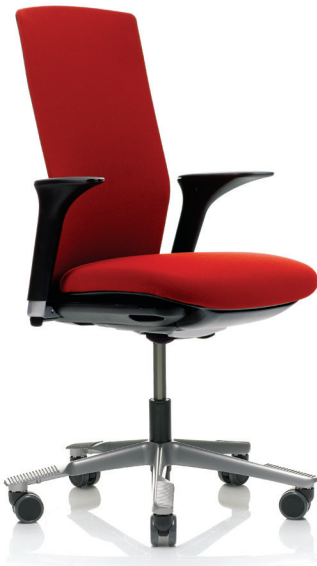
HÅG Futu 1020 - armstöd kan fås som tillbehör.