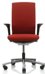
HÅG Futu 1020 - armstöd kan fås som tillbehör.