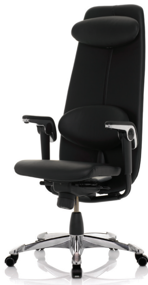
HÅG H09 Classic 9130 n/Fotkryss i polerat aluminium (tillval)