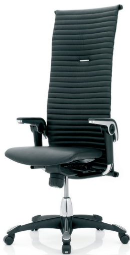
HÅG H09 Excellence 9330