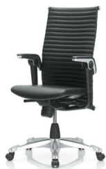
HÅG H09 Excellence 9320 n/polished aluminium star base (optional)