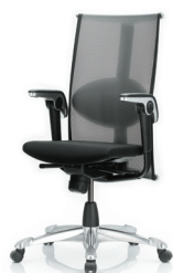
HÅG H09 Inspiration 9220 n/Fotkryss polerad aluminium (tillval)