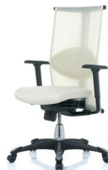
HÅG H09 Inspiration 9220