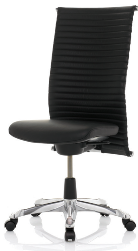
HÅG H09 Meeting 9372 n/Fotkryss i polerat aluminium (tillval)