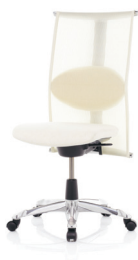
HÅG H09 Meeting 9272 n/Fotkryss i polerat aluminium (tillval)