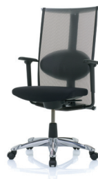
HÅG H09 Meeting 9272 n/Fotkryss i polerat aluminium (tillval) och armstöd (tillval)